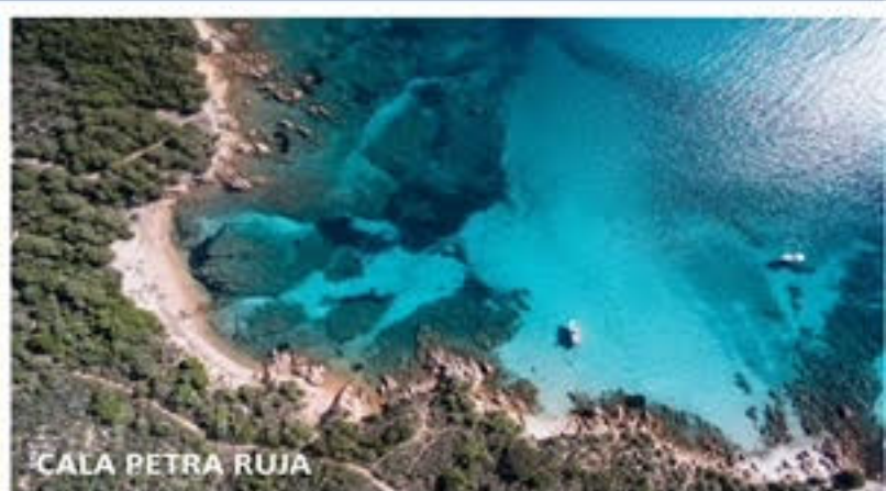
CALA PETRA RUJA