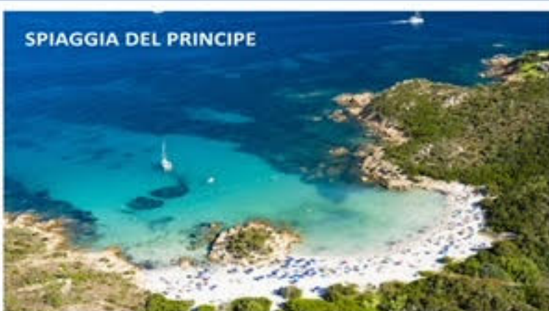
SPIAGGIA DEL PRINCIPE