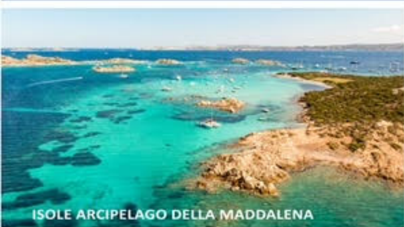
ISOLE ARCIPELAGO DELLA MADDALENA