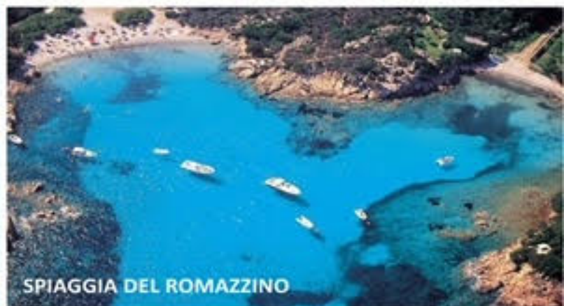
SPIAGGIA DEL ROMAZZINO