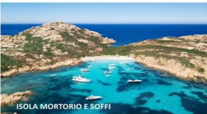
ISOLA MORTORIO E SOFFI